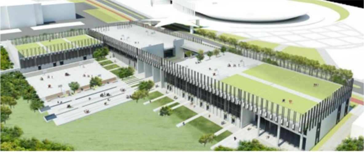
Spor Tesisleri Projesi