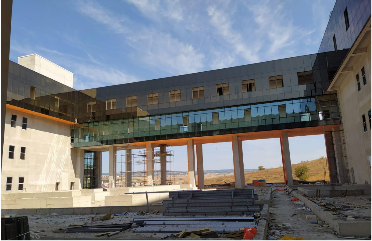
Mühendislik Fakültesi Laboratuvar Binası İnşaatı