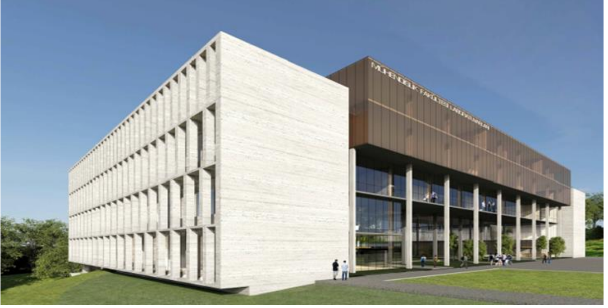
Mühendislik Fakültesi Laboratuvar Binası Projesi