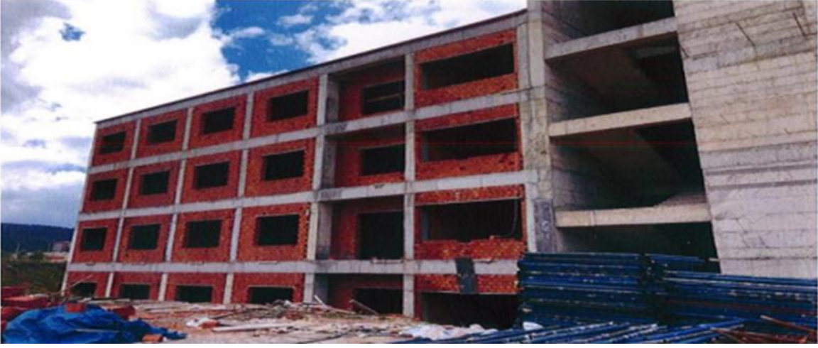
Ovacık Spor Meslek Yüksekokulu