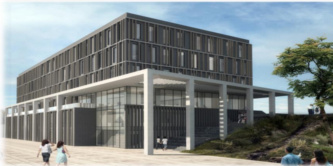
Öğrenci İşleri Merkezi İnşaatı