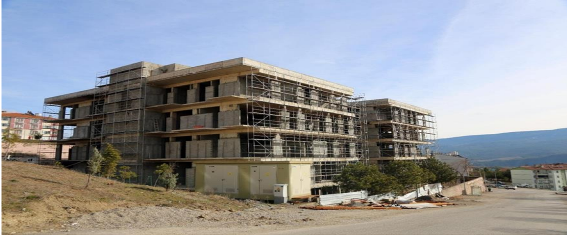
Sosyal Bilimler Meslek Yüksekokulu İnşaatı

2017 yılı içerisinde ihalesi yapılan 12.000 m2 kapalı alana sahip ‘‘Sosyal Bilimler Meslek Yüksekokulu Binası Projesinin’’ ihale bedeli (KDV dahil) 16.520.000 TL olup; yapımına 2017 yılı Ekim ayı içerisinde Beşbınevler Yerleşkesinde başlanmıştır. Proje için 2017 yılında 1.265.527,72 TL, 2018 yılında 3.861.187,28 TL, 2019 yılında ise 757.522,09 TL kümülatif olarak ise toplamda 5.884.237,09 TL harcama yapılmıştır. Yüklenici firma işi tamamlayamamış olup, Çevre ve Şehircilik Bakanlığında firmanın tasviyesi için onay alınmış ve yıl sonuna kadar tasviye süreci tamamlanmıştır. Proje yılı ödeneğinden Mühendislik Fakültesi Laboratuvar Binası Projesine 2.000.000 TL, Muhtelif İşler Projesine ise 170.000 TL aktarılmıştır.