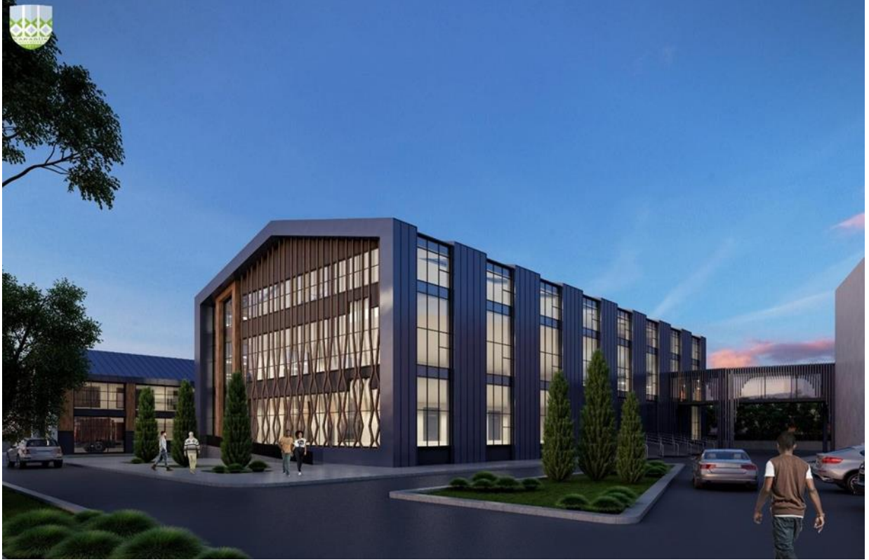
TOBB Teknik Bilimler Meslek Yüksekokulu

2017 yılı içerisinde ihalesi yapılan 6.500 m2 kapalı alana sahip “TOBB Teknik Bilimler Meslek Yüksekokulu (Ek) Bina İnşaatı” projesinin ihale bedeli (KDV dahil) 12.150.460 TL’dir. 2018 yılı Kasım ayı içerisinde Karabük Organize Sanayi Bölgesindeki Üniversitemize tahsis edilen TOBB yerleşkimizdeki eğitim binamızın yanında ek bina olarak yapımına başlanmış olup 2019 yılında 4.757.523,34 TL harcama yapılmıştır. Bugüne kadar yapılan kümülatif harcama 11.338.262,34 TL’dir. Proje ödeneğinden Derslik ve Merkezi Birimler Projesinin alt projelerinden Mühendislik Fakültesi Laboratuvar Binası Projesine 3.000.000 TL, Öğrenci İşleri Merkezi Projesine ise 700.000 TL aktarılmıştır. İşin bitirilmesi için yüklenici firmaya İdaremizce 17.11.2019 tarihine kadar cezalı süre uzatımı verilmiş ancak, iş bitirilemediğinden 19.11.2019 tarihli Rektörlük Olur'u ile sözleşme feshedilmiştir.