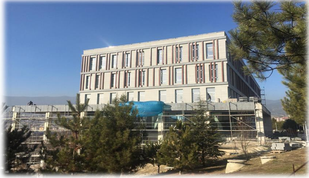
Öğrenci İşleri Merkezi İnşaatı

2018 yılı içerisinde ihalesi yapılan 7.800 m2 kapalı alana sahip ve maliyetinin tamamı Üniversitemiz likit değerlerinden karşılanacak olan “Öğrenci İşleri Merkez Binası” projesinin ihale bedeli (KDV dahil) 19.458.000 TL olup; 2018 yılı haziran ayı içerisinde Demir Çelik Yerleşkesinde yapımına başlanmış olup, 2018 yılında 5.597.879,74 TL, 2019 yılında ise 17.737.307,46 TL harcama yapılmıştır. Bugüne kadar yapılan kümülatif harcama 23.335.187,20 TL olarak gerçekleşmiş olup, işin 2020 yılı mart ayı sonuna kadar bitirilmesi öngörülmektedir.