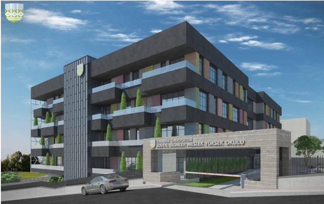
Sosyal Bilimler Meslek Yüksekokulu Projesi