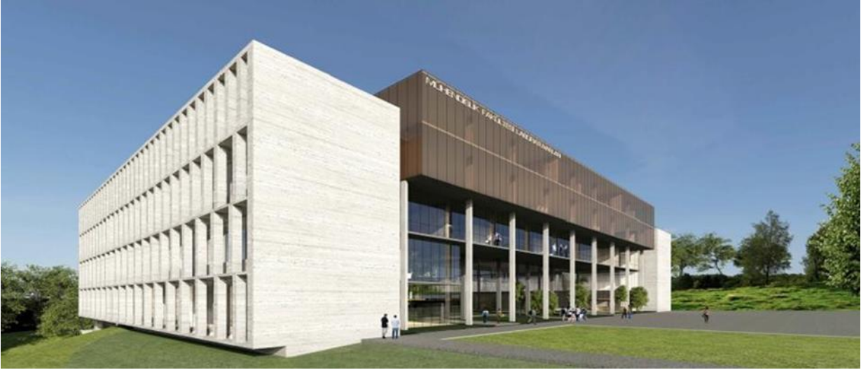
Mühendislik Fakültesi Laboratuvar Projesi