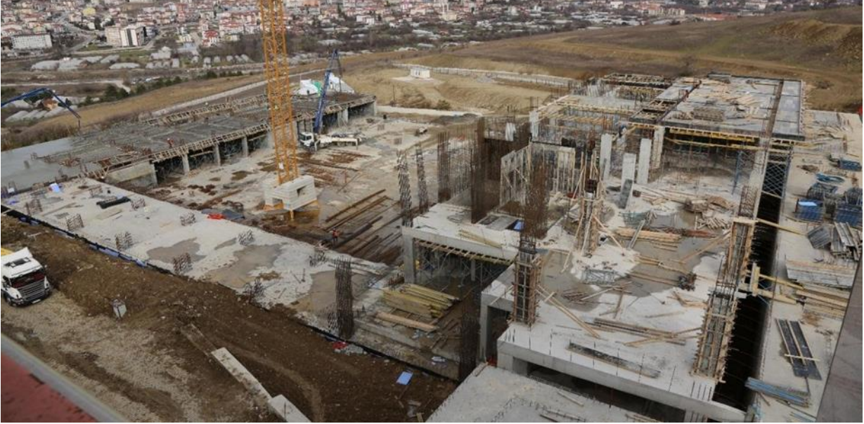
Mühendislik Fakültesi Laboratuvar İnşaatı

2018 yılı içerisinde ihalesi yapılan 20.800 m2 kapalı alana sahip “Mühendislik Fakültesi Laboratuvar Binası” projesinin ihale bedeli (KDV dahil) 46.462.500 TL olup; Demir Çelik Yerleşkesi Mühendislik Fakültesi yanındaki alanda yapımına başlanmış ve 2019 yılında 13.497.167,05 TL harcama yapılmış olup, kümülatif harcaması 24.817.631,05 TL’yi bulmuştur. Yatırım Bütçesindeki daralmadan dolayı projenin 2022 yılı sonuna doğru bitilmesi öngörüldüğünden idaremizce proje bitiş tarihinin 31.12.2022 tarihine kadar uzatılmasına karar verilmiştir.