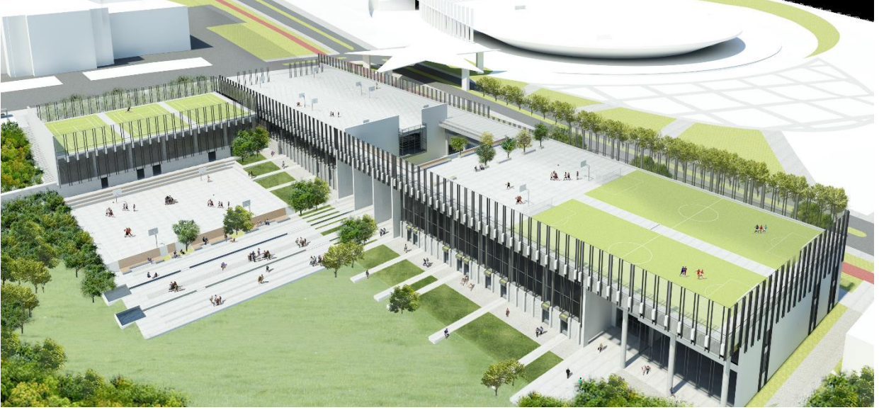
Spor Tesisleri projesi

2019 yılı proje bedeli 27.300.000 TL olup yılı başlangıç ödeneği 1.500.000 TL'dir. Proje kapsamında halı sahalardan, tenis kortlarının ve içerisinde basketbol ve voleybol sahalardan da yer aldığı 1 adet spor kompleksi yapım işi ihalesi (KDV dahil) 17.500.000 TL bedelle 2018 yılı içerisinde tamamlanmış ve 2018 yılı içerisinde 5.861.503 TL harcama yapılmıştır. 2019 yılında proje kapsamında herhangi bir harcama yapılmamış olup, 1.500.000 TL tutarındaki yılı proje ödeneğinin tamamı Cumhurbaşkanlığı Strateji ve Bütçe Başkanlığının uygun görüşü üzerine Derslik ve Merkezi Birimler Projesinin bir alt projesi olan Öğrenci İşleri Merkezi Projesine aktarılmıştır.