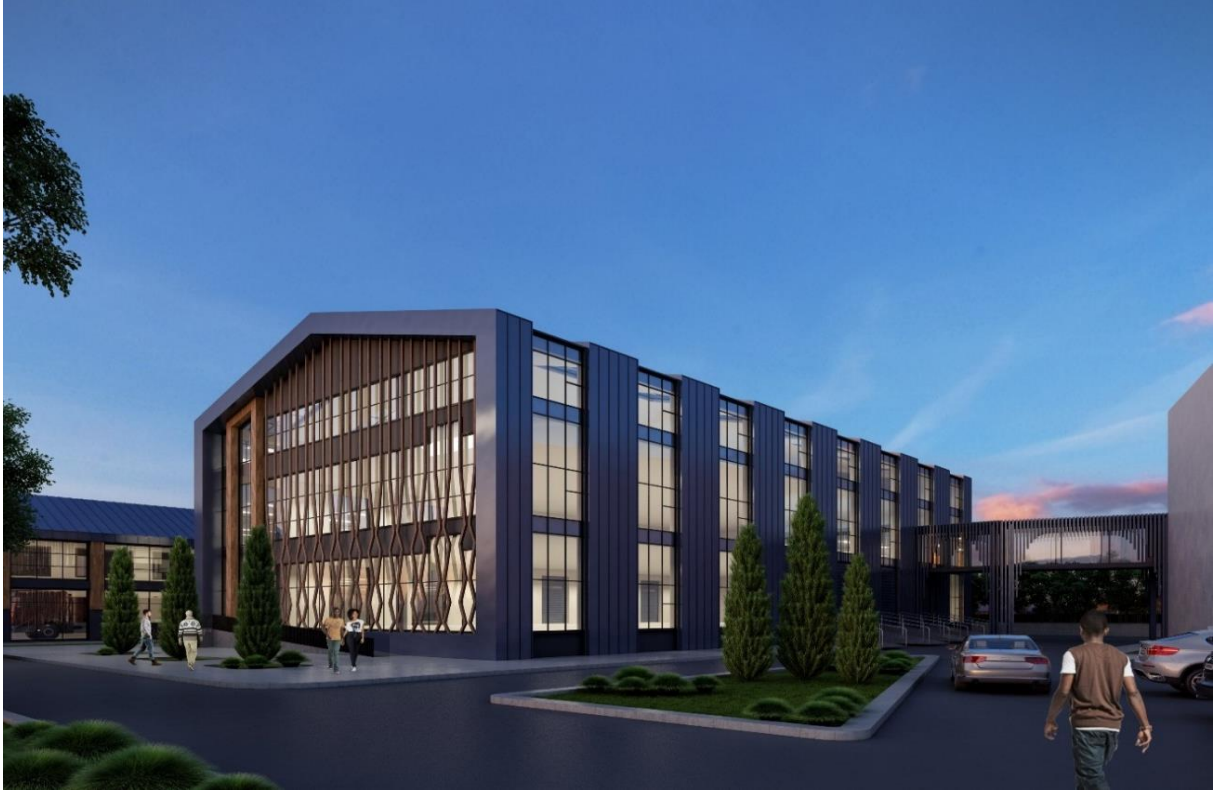
TOBB Teknik Bilimler Meslek Yüksekokulu Ek Bina

2017 yılı içerisinde ihalesi yapılan 6.500 m 2 kapalı alana sahip “TOBB Teknik Bilimler Meslek Yüksekokulu (Ek) Bina İnşaatı” projesinin ihale bedeli (KDV dahil) 12.150.460 TL’dir. 2018 yılı Kasım ayı içerisinde Karabük Organize Sanayi Bölgesindeki Üniversitemize tahsis edilen TOBB yerleşkemizdeki eğitim binamızın yanında ek bina olarak yapımına başlanmış olup 2020 yılında 7.211.548,36 TL harcama yapılmıştır. Bugüne kadar yapılan kümülatif harcama 18.549.548,36 TL’dir.