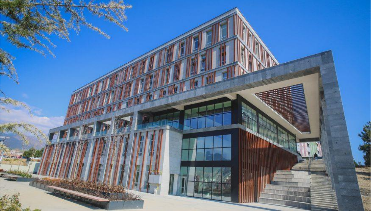
Öğrenci İşleri Merkezi

2018 yılı içerisinde ihalesi yapılan 7.800 m2 kapalı alana sahip ve maliyetinin tamamı Üniversitemiz likit değerlerinden karşılanacak olan “Öğrenci İşleri Merkez Binası” projesinin ihale bedeli (KDV dahil) 19.458.000 TL olup; 2018 yılı haziran ayı içerisinde Demir Çelik Yerleşkesinde yapımına başlanmış olup, 2018 yılında 5.597.879,74 TL, 2019 yılında ise 17.737.307,46 TL harcama yapılmıştır. Bugüne kadar yapılan kümülatif harcama 23.335.187,20 TL olarak gerçekleşmiştir. Yeni ve modern bir bina olarak inşa edilen Öğrenci İşleri Merkezi 2020 yılının Mart ayında faaliyete geçti.