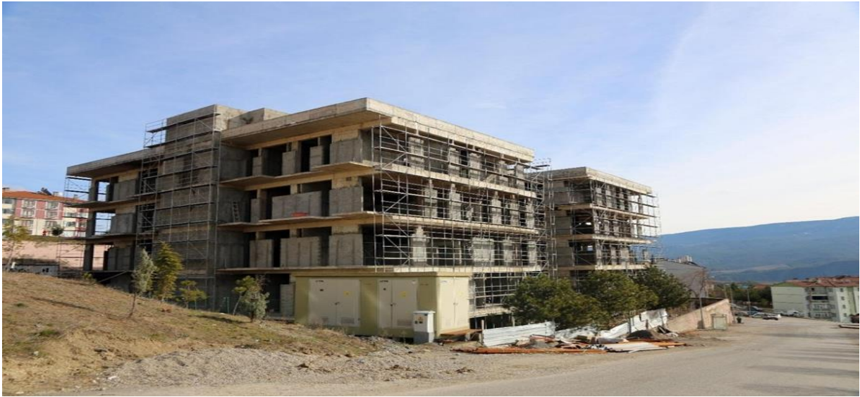
Sosyal Bilimler Meslek Yüksekokulu İnşaatı

2017 yılı içerisinde ihalesi yapılan 12.000 m 2 kapalı alana sahip “Sosyal Bilimler Meslek Yüksekokulu Binası Projesinin” ihale bedeli (KDV dahil) 16.520.000 TL olup; yapımına 2017 yılı Ekim ayı içerisinde Beşbinevler Yerleşkesinde başlanmıştır. Proje için 2017 yılında 1.265.527,72 TL, 2018 yılında 3.861.187,28 TL, 2019 yılında ise 757.522,09 TL kümülatif olarak ise toplamda 5.884.237,09 TL harcama yapılmıştır. Yüklenici firma işi tamamlayamamış olup, Çevre ve Şehircilik Bakanlığında firmanın tasviyesi için onay alınmış ve yıl sonuna kadar tasviye süreci tamamlanmış olup inşaat halindeyken Sağlık Bakanlığı talebi üzerine bakanlığa devredilmiştir. Yılı ödeneği olan 302.000 TL TOBB Teknik Bilimler Meslek Yüksekokulu İkmal İnşaatı yapım işine aktarılmıştır.