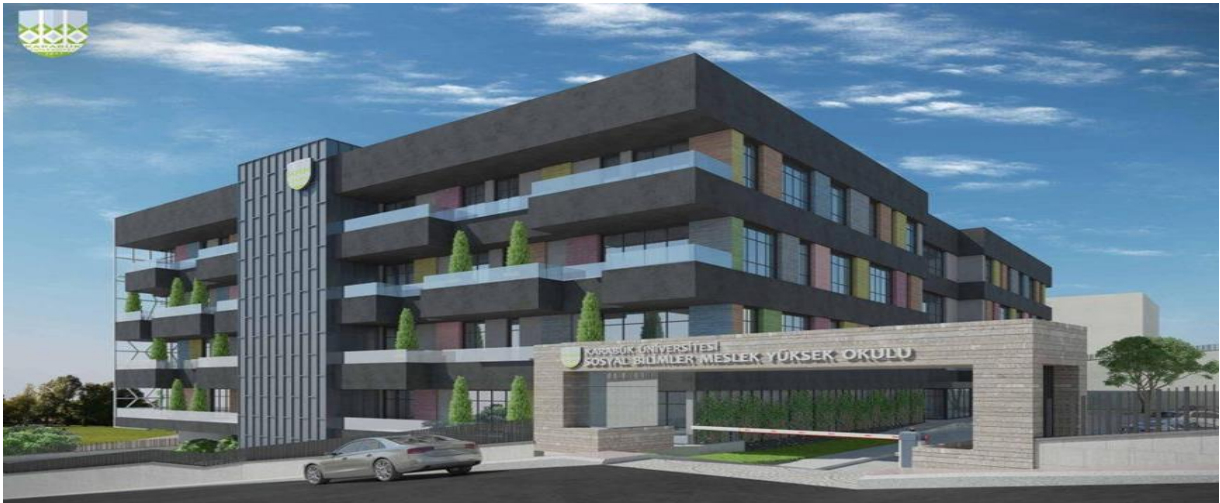
Sosyal Bilimler Meslek Yüksekokulu Projesi