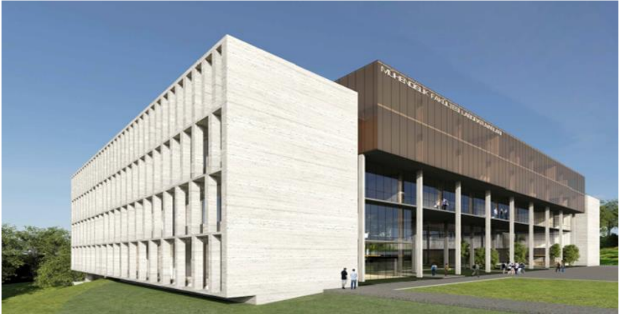
Mühendislik Fakültesi Laboratuvar Binası Projesi