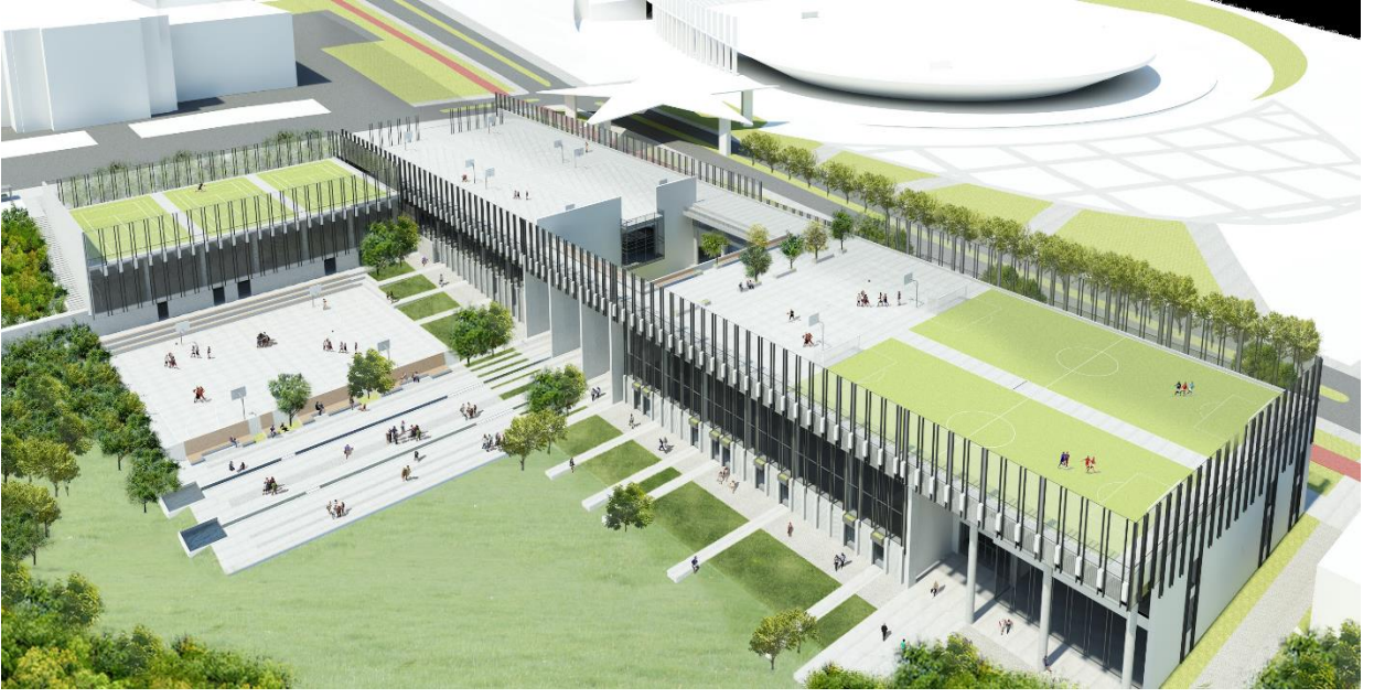
Spor Tesisleri Projesi