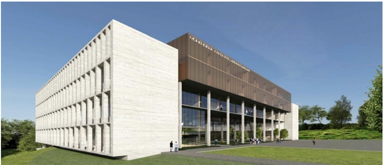
Mühendislik Fakültesi Laboratuvar Projesi