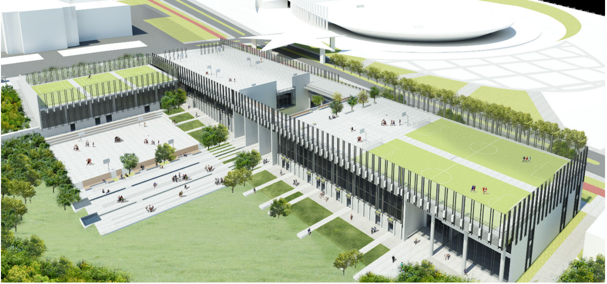
Spor Tesisleri projesi

2018 yılı proje bedeli 23.000.000 TL olup yılı başlangıç ödeneği 6.000.000 TL'dir. Proje kapsamında halı sahalarn, tenis kortlarının ve içerisinde basketbol ve voleybol sahalarnın da yer aldığı 1 adet spor kompleksi yapımı işi ihalesi (KDV dahil) 17.500.000 TL bedelle 2018 yılı içerisinde tamamlanmış ve yıl içerisinde 5.861.503 TL harcama yapılmıştır. Projenin 2019 yılında bitirilmesi hedeflenmektedir.