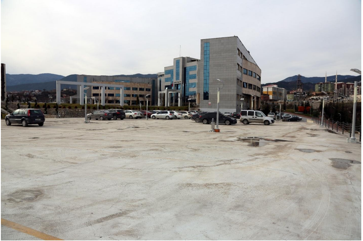
Rektörlük Açık ve Kapalı Otopark Projesi

Proje kapsamında Rektörlük Binası yanına 2.657 m2 kapalı ve 2.390 m2 açık alana sahip (KDV dahil) 2.724.620 TL ihale bedelli "Kapalı ve Açık Otopark" yapım işi için 2.425.265 TL harcanarak 2018 yılı Temmuz ayı içerisinde faaliyete geçmiştir.