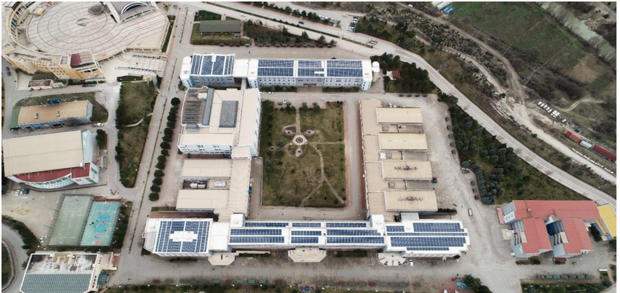
Fotovoltaik Güç Santrali