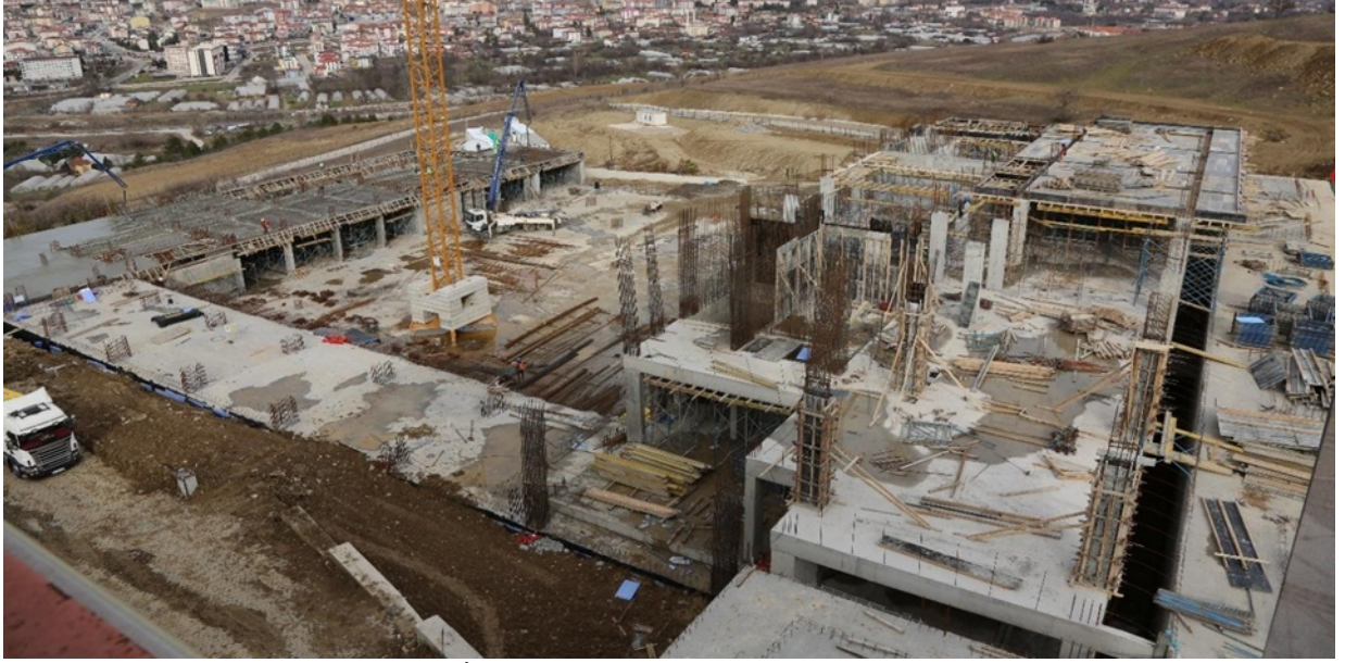
Mühendislik Fakültesi Laboratuvar İnşaatı

2018 yılı içerisinde ihalesi yapılan 20.800 m 2 kapalı alana sahip "Mühendislik Fakültesi Laboratuvar Binası" projesinin ihale bedeli (KDV dahil) 46.462.500 TL olup; Temmuz ayı içerisinde Demir Çelik Yerleşkesi Mühendislik Fakültesi yanındaki alanda yapımına başlanmış ve yıl sonuna kadar toplamda 11.321.646 TL harcama yapılmıştır. Laboratuvar Binasının 2020 yılında bitirilerek faaliyete geçirilmesi hedeflenmektedir.